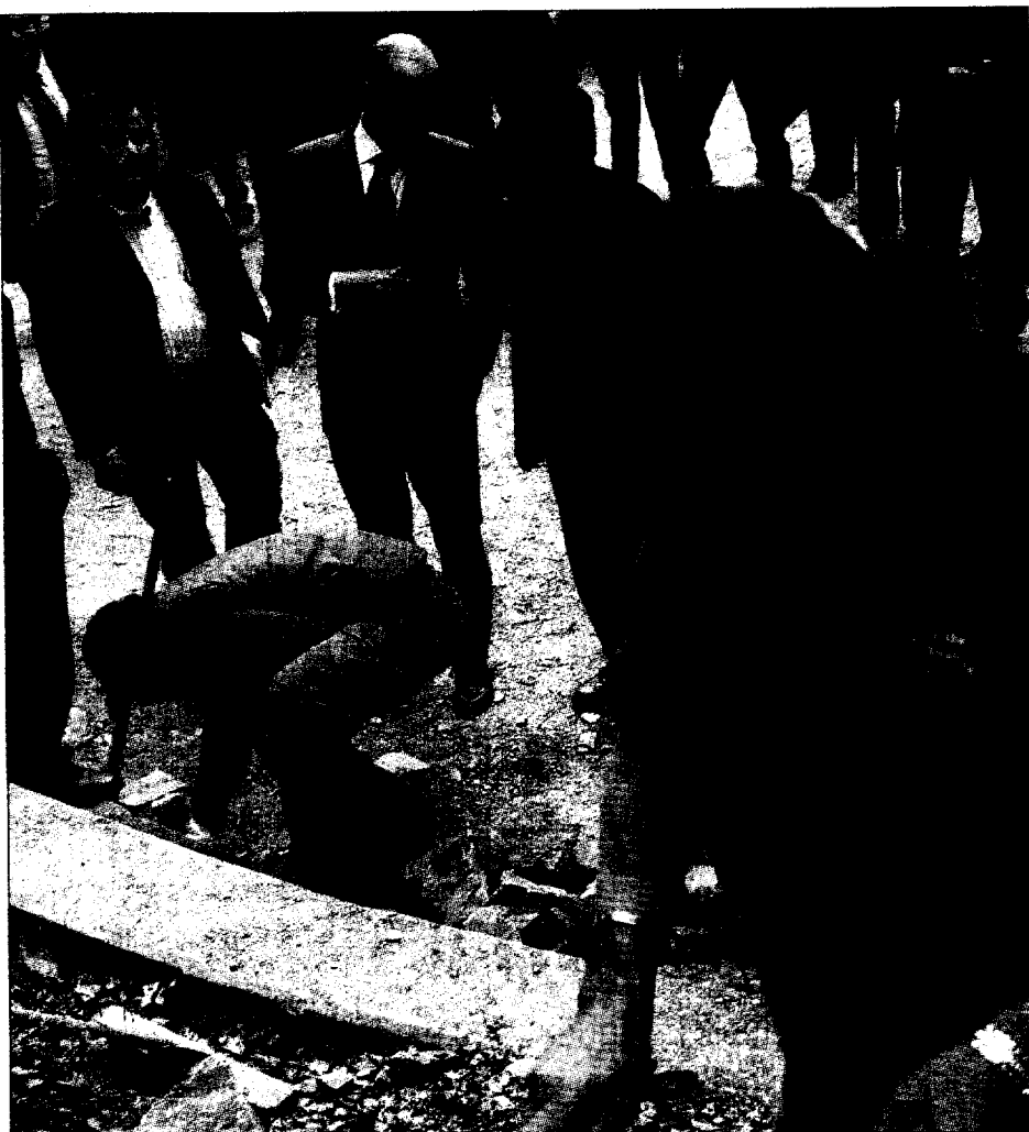
Una de les actuacions fetes per l'Obra Social de la Caixa al parc de Collserola ■ MARTA PÉREZ