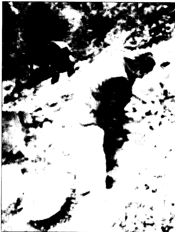
Dos treballadors fent arranjaments ahir a Collserola. EROS ALBARRÁN